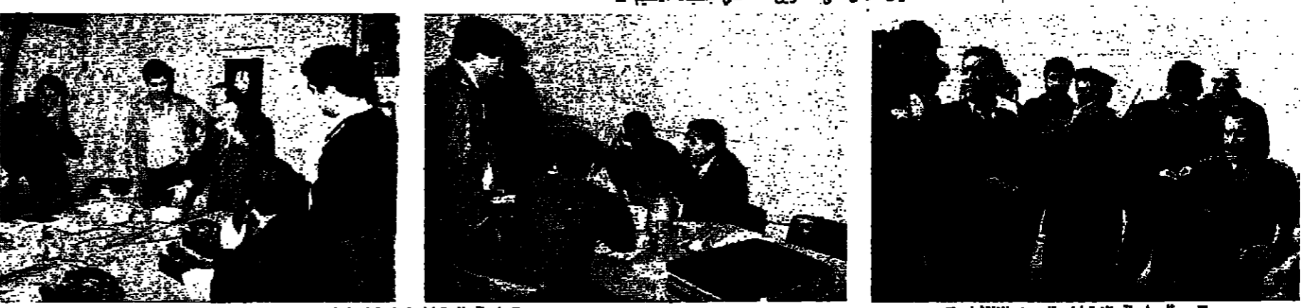
ممثلو لجنة الارتباط يتبعون الانتشار